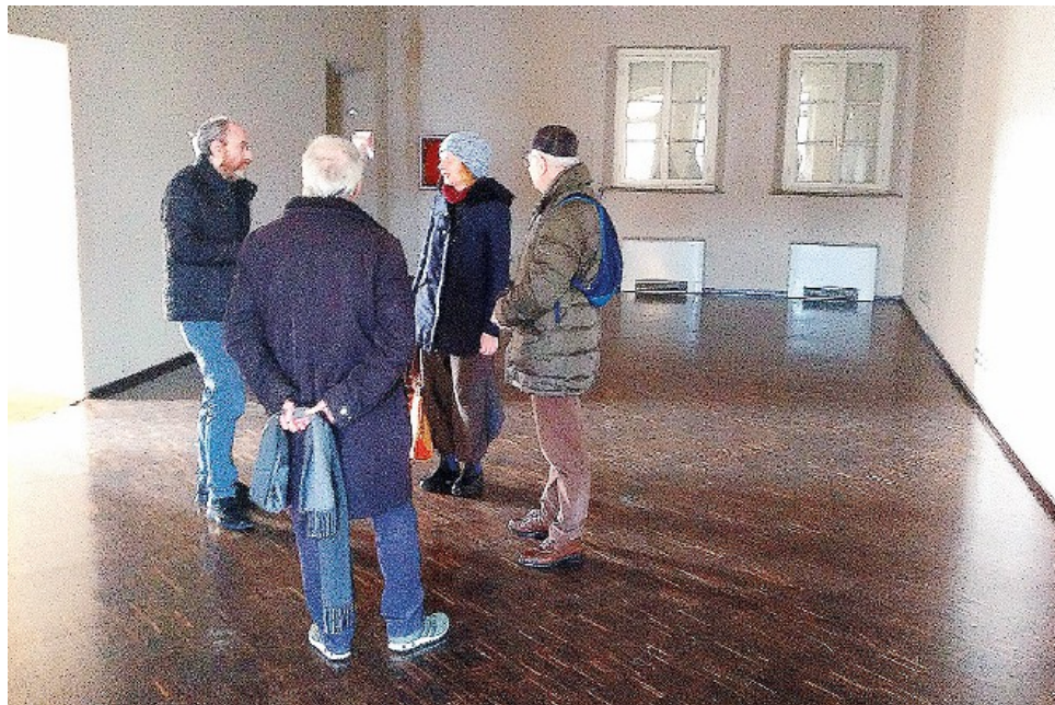
Gli organizzatori al sopralluogo di martedì all'ingresso della sala Chagall al Castello