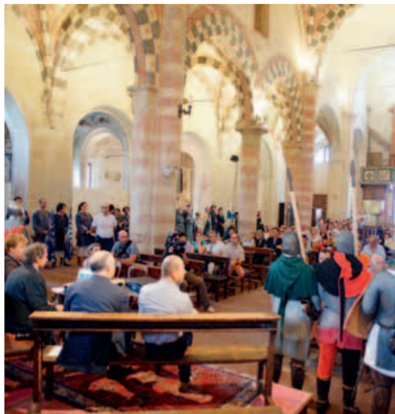
La Verbal Tenzzone (sopra) sabato ha aperto l'edizione 2011 della Festa Medioevale di Cassine; sopra, una suggestiva immagine scattata sempre il primo giorno