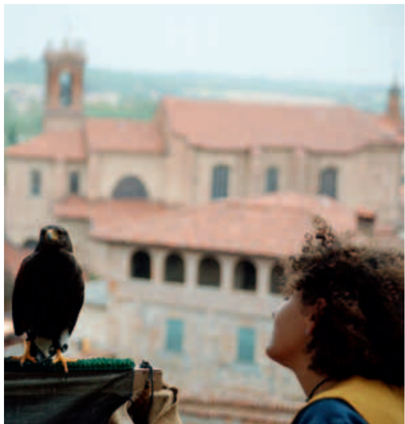
La Verbal Tenzzone (sopra) sabato ha aperto l'edizione 2011 della Festa Medioevale di Cassine; sopra, una suggestiva immagine scattata sempre il primo giorno